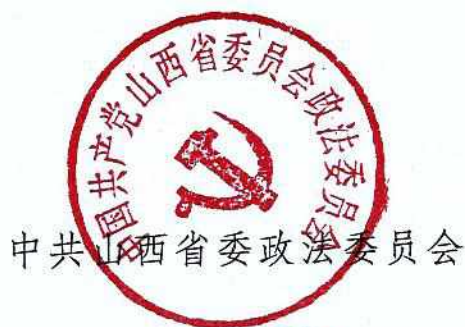
中共山西省委政法委员会