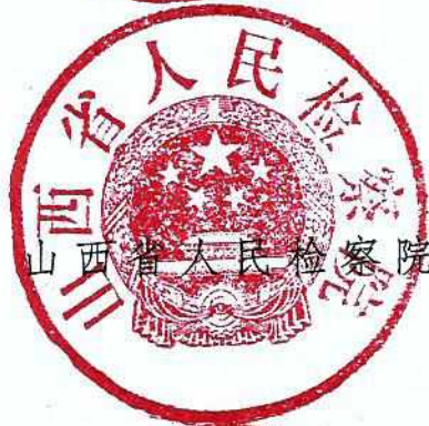
山西省人民检察院