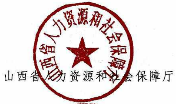
山西省人力资源和社会保障厅