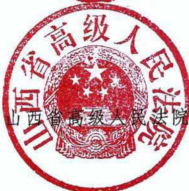
山西省高级人民法院