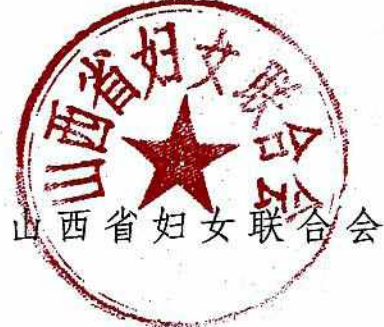
山西省妇女联合会